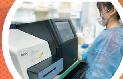
遺伝子解析 次世代シーケンサー