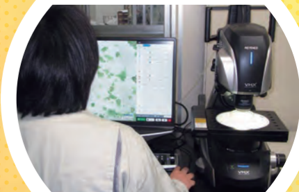
デジタル実体 顕微鏡